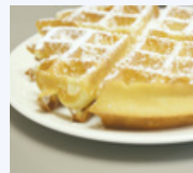
Frische Waffeln im Caféchen